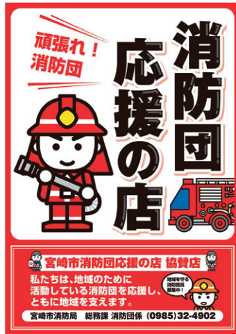
ポスター及びステッカー

そのような中、主に消防団幹部で構成する「宮崎市消防団組織体制検討委員会」で団員確保対策